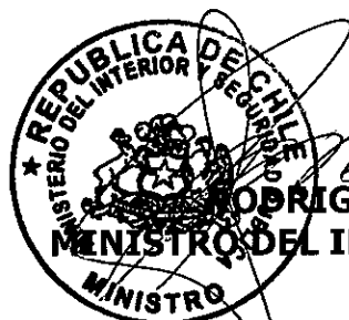
RODRIGO PEÑAILILLO BRICEÑO MINISTRO DEL INTERIOR Y SEGURIDAD PÚBLICA