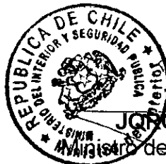
JORGE BURGOS VARELA Ministro del Interior y Seguridad Pública