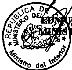
EDUARDO PÉREZ YOMA MINISTRO DEL INTERIOR