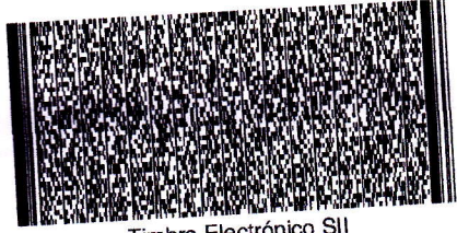
Timbre Electrónico SII

Res.86 de 2005 Verifique documento: www.sii.cl