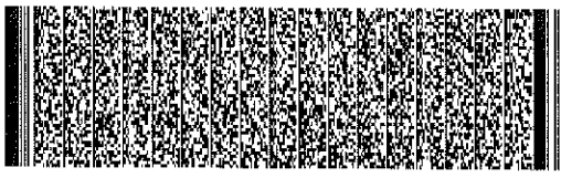
Timbre Electronico S.I.I

acuse de recibo que se declara en este acto, de acuerdo a lo dispuesto en la letra b) del Art. 4 y la letra c) del Art. 5 de la Ley 19.983, acredita que la entrega de mercaderías o servicio(s) prestado(s) ha(n) sido recibid