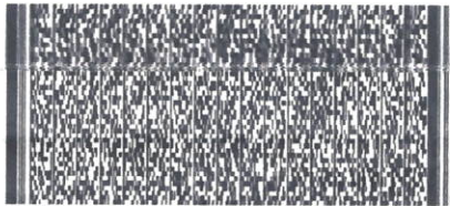
Timbre Electrónico SII

Res.99 de 2014 Verifique documento: www.sii.cl