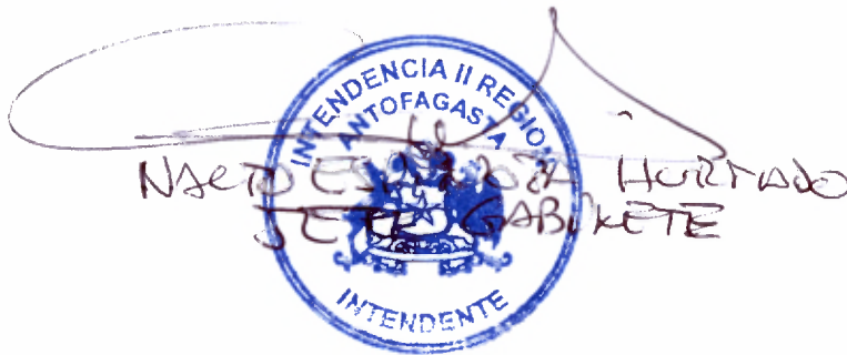
VICTOR HENRIQUEZ GONZALEZ Contralor Regional de Antofagasta Contraloría General de la República